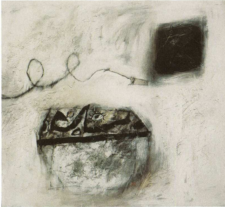
名称：《共生一界中》年代：1993,规格：117x114cm,材质：布面、丙烯、拼贴、混合材料